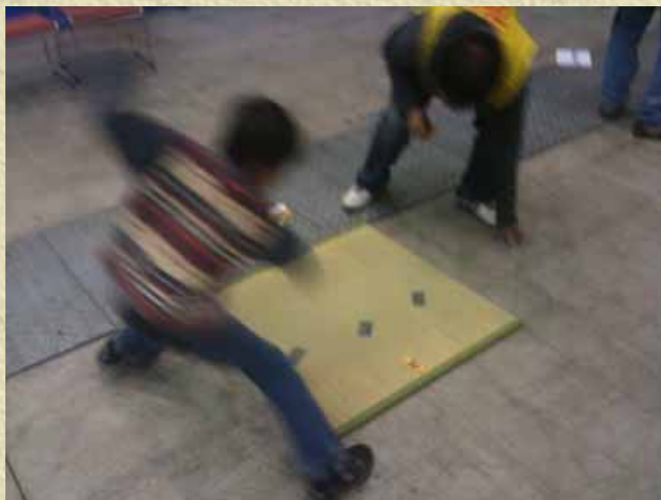
めんこ 3回開催 36名