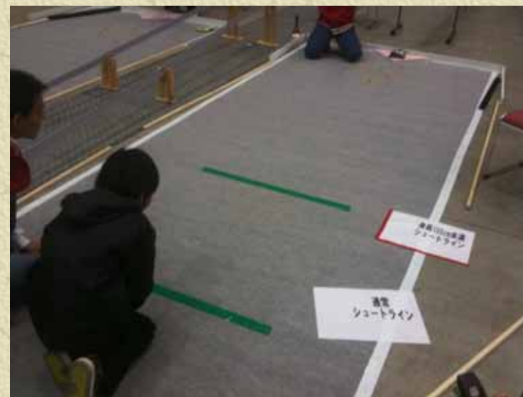
ビー玉 3回開催 24名