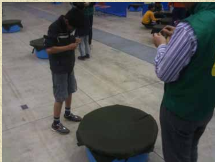
ベーゴマ 3回開催 35名