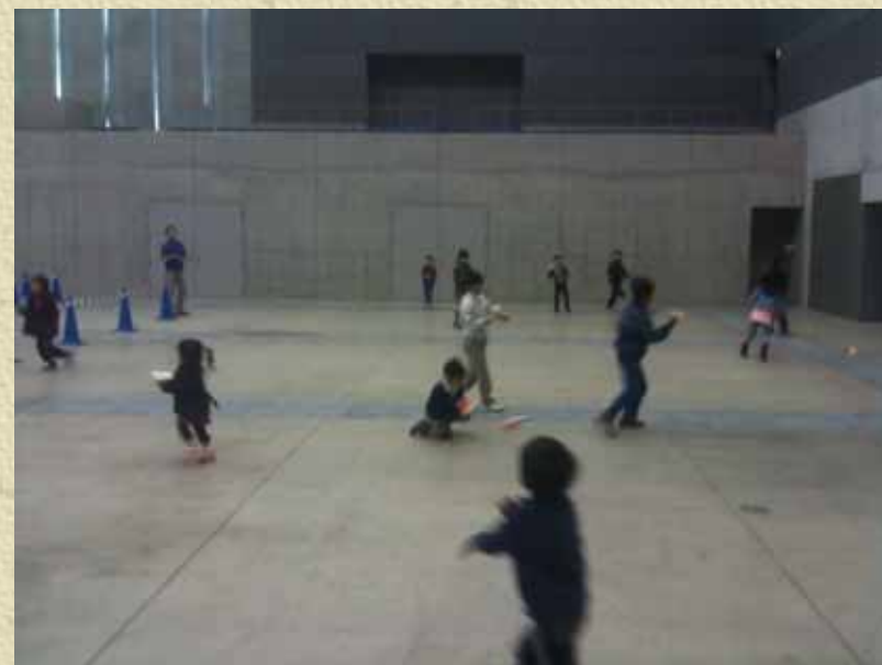
折り紙ヒコーキ 2回開催 86名