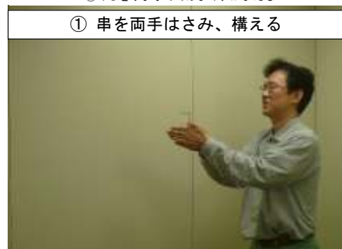
① 串を両手はさみ、構える