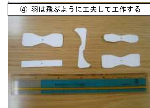
④ 羽は飛ぶように工夫して工作する