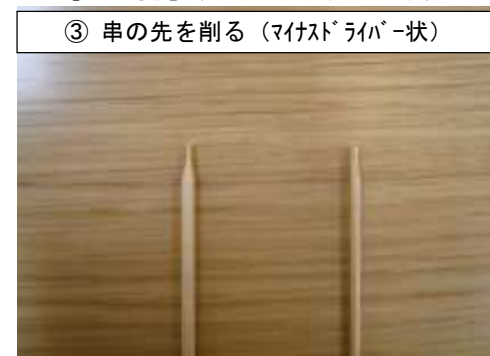
③ 串の先を削る（マイナスドライバー状）