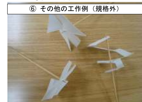
⑥ その他の工作例（規格外）