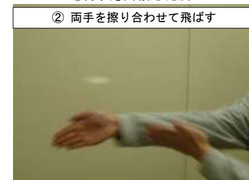
② 両手をすり合わせて飛ばす