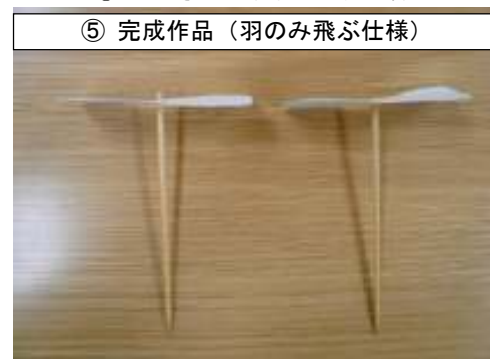
⑤ 完成作品（羽のみ飛ぶ仕様）