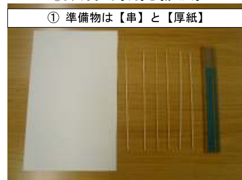
① 準備物は【串】と【厚紙】